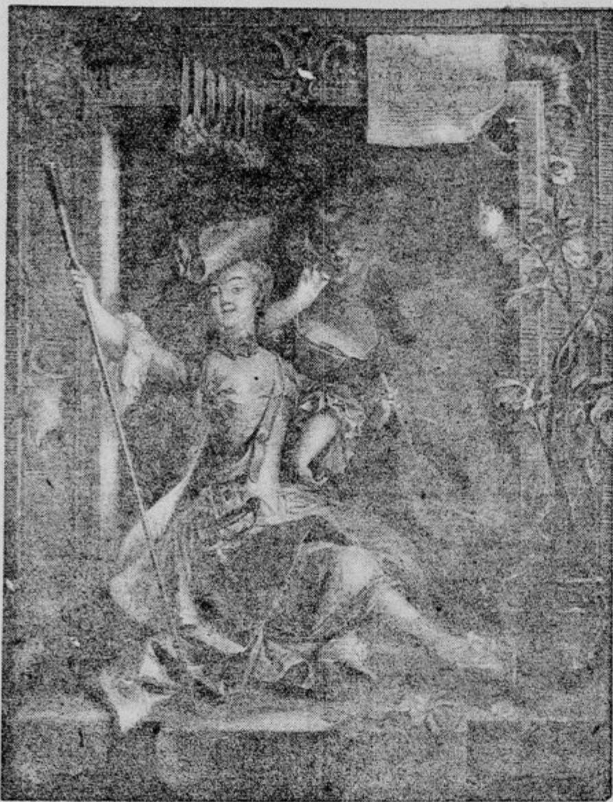
Habibou: Venerini dragonci, po sliki Eisena.