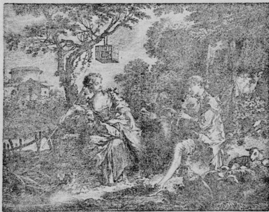
Duflos: Pastirska igra, po sliki Bouchera.