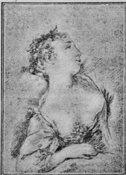
Bonnet: Poprsje žene, po sliki Bouchera

Navodila za fotografe amatorje izšla Cena Din 16.— Drogerija A. Kanc sinova, Židovska ul.